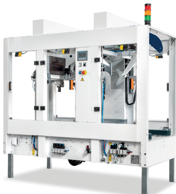
Standardversion av CT 305 SDRF